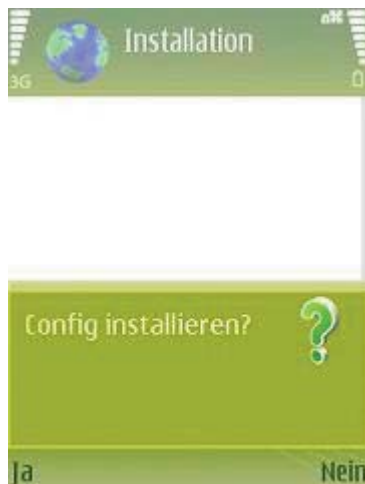
Abb 4: Installieren?