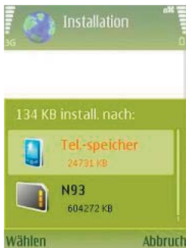
Abb 16 Installationsort

Sollten Sie zusätzlichen Speicher in Ihrem Handy installiert haben (über kaufbare Karten) so können Sie die Software selbstverständlich auch auf dieser installieren.