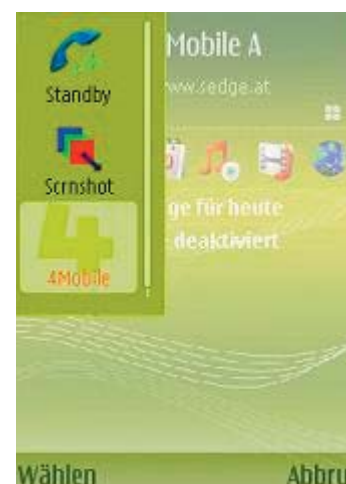
Abb 14 Taskmanager

Nun können Sie mithilfe der "C-Taste" das Programm beenden. Nachdem Sie die Rückfrage Ihres Gerätes mit "Ja" beantwortet haben wird das Programm geschlossen.