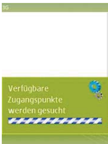
Abb 3: Suche Zugang

Nach dem Anklicken des Links innerhalb der Dienstmitteilung wird das Herunterladen automatisch gestartet. Auch hier gibt es zwei Optionen: