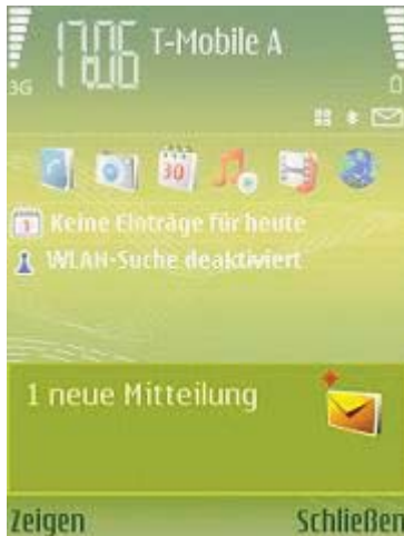
Abb 1: Softwareempfang

Nach erfolgter Freischaltung in unserem System erhalten Sie von uns 3 SMS zugesandt. Folgende Mitteilungen werden an Ihr Endgerät zum Versandt gebracht: