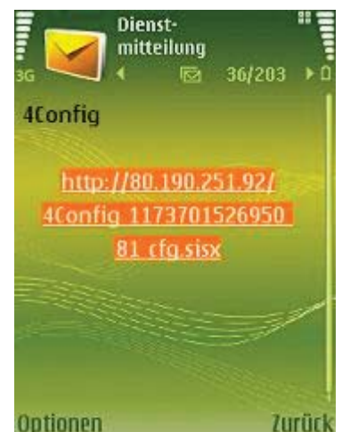
Abb 2: SMS geöffnet