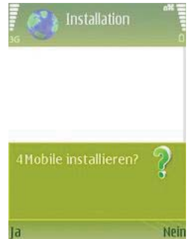
Abb 6: Installieren?

Nach erfolgter Verbindungsherstellung fragt Ihr Gerät, ob Sie 4Config wirklich installieren möchten. Diese Frage können Sie mit "Ja" beantworten (Abb 4)