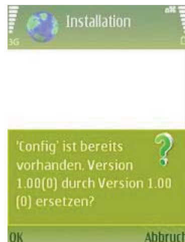
Abb 15 Ersetzen?

Diese Frage können Sie mit "OK" beantworten - es startet wie gewohnt die Installationsroutine.