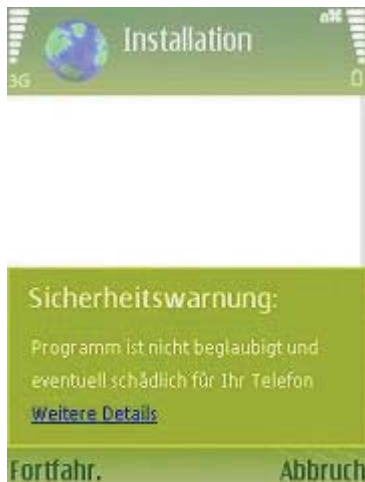
Abb 8 Warnung

Die nun folgende Sicherheitswarnung können Sie ebenfalls ohne Probleme mit "Fortfahren" bestätigen.