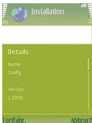
Abb 7 Details

Bevor die eigentliche Installationsroutine beginnt, erscheint ein Informationsbildschirm, der nochmals die Details zur 4Mobile-Software anführt.