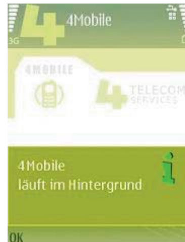
Abb 12 Hintergrund

Sollte hier "Off" in roter Schrift erscheinen, oder gar kein Wort, so ist die Software nicht aktiviert, bzw. nicht installiert.