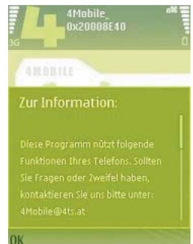
Abb 10 Information

Diese Meldung können Sie mit "OK" bestätigen.