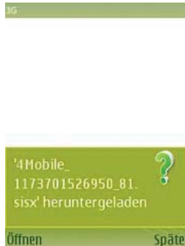
Abb 5: Laden und Öffnen