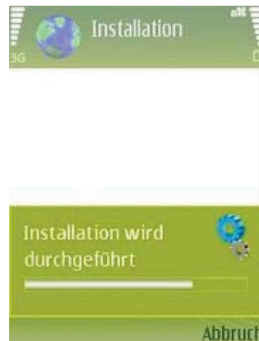
Abb 9 Installation

Die nun folgende Sicherheitswarnung können Sie ebenfalls ohne Probleme mit "Fortfahren" bestätigen.