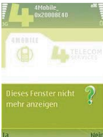
Abb 11 Programmfenster

Es ist möglich, das Anzeigefenster abzuschalten, indem die nun folgende Frage mit "Nein" beantwortet wird. Beachten Sie bitte, dass das Programm trotzdem im Hintergrund mitläuft und seine Aufgabe wahrnimmt.