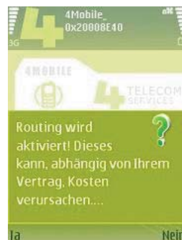
Abb 17 Aktivieren

Beachten Sie jedoch, dass im Falle der Entfernung dieser Karte die Software eventuell nicht mehr einwandfrei funktionieren kann!